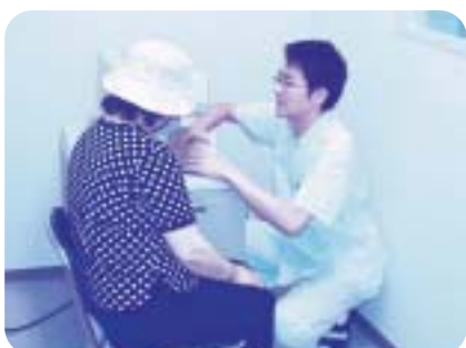
骨塩定量検査の様子

※骨塩定量検査は骨のカルシウムやリンの量を測る検査です。当院の機械は利き手の逆の前腕を使用し、X線透過による骨塩量を測る装置です。検査は1分～3分程度で終了します。尚、整形外科外来では月1回骨粗しょう症専門外来を行っております。(予約制)