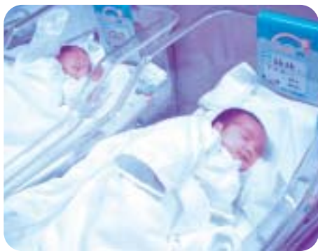
新生児室の赤ちゃん

従来から産婦人科医師の人数が減少していることが問題となっていました。産婦人科医師の高齢化や退職、産婦人科を志望する若い医師の減少、平成16年度から始まった卒後臨床研修医制度に伴い、今後2年間大学への入局者が皆無となることなどから産婦人科医師の人数は減少の一途をたどっています。このため、従来は大学医局から派遣されていた各地の市立病院などの常勤医師も、これまでのようにすべての市立病院には派遣できなくなってしまいました。