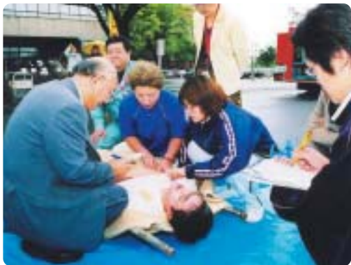
トリアージ訓練の様子

メイクを施した40人の模擬患者（写真右下）は、救急隊により担架で運び出され、（写真左上）待ち構える1チーム4人の救護班が重傷度を確認（トリアージ）（写真左下）