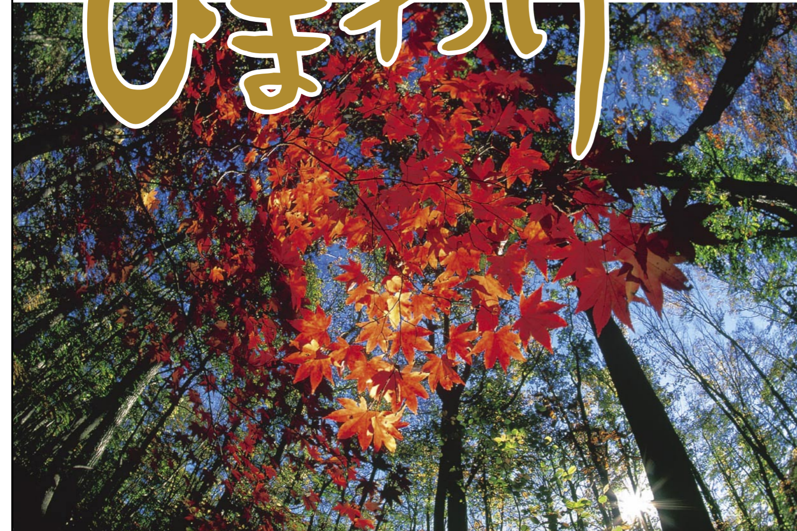
「旭日の紅」