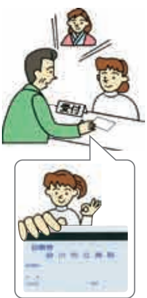
会計時に診察カードの提出をお願いします。