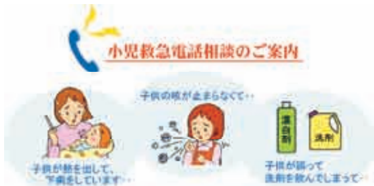
など、小児救急に関する相談を受け付けています。

※短縮ダイヤル「#8000」は、 ご家庭のプッシュ回線及び携帯電話 からご利用になれます。