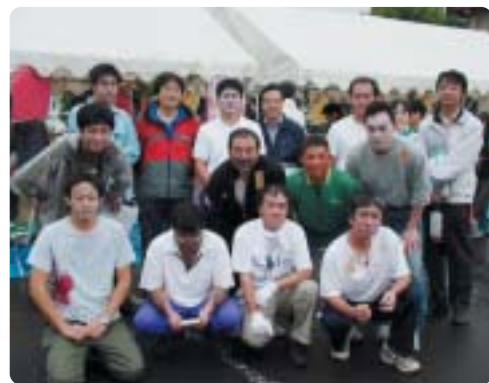
模擬患者の皆さん

し、処置をします。同時に本部では連絡体制の訓練が行われ、本番さながらの緊張感ある訓練を実施いたしました。今後も災害拠点病院としての役割を果たしていきます。