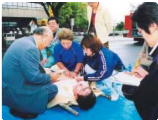
トリアージ訓練の様子

メイクを施した40人の模擬患者（写真右下）は、救急隊により担架で運び出され、（写真左上）待ち構える1チーム4人の救護班が重傷度を確認（トリアージ）（写真左下）