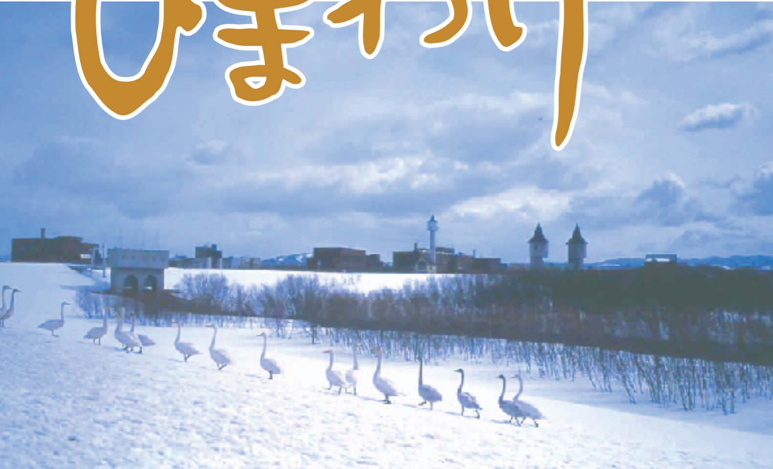
『春の使者』