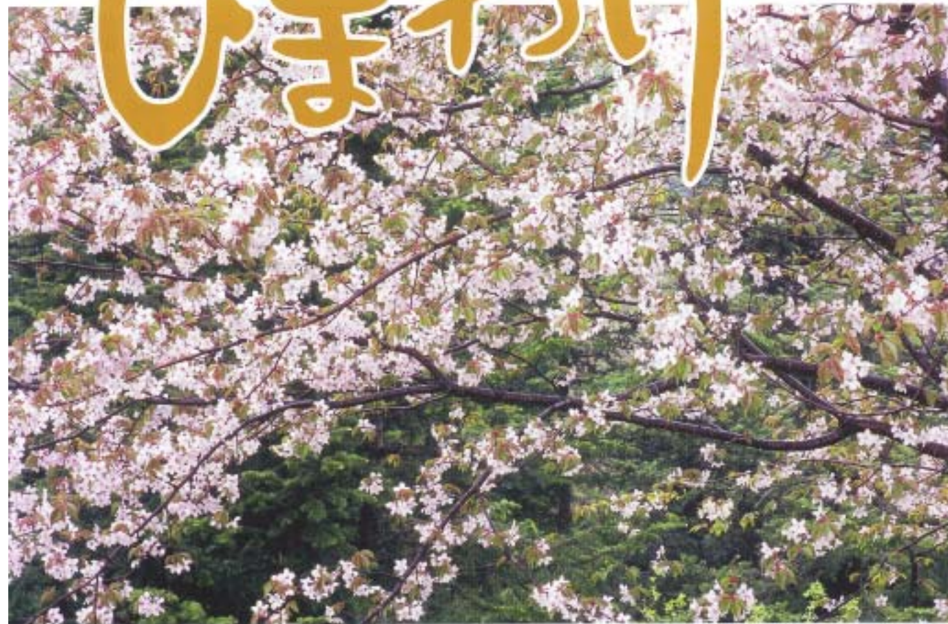
〔エゾヤマザクラ〕