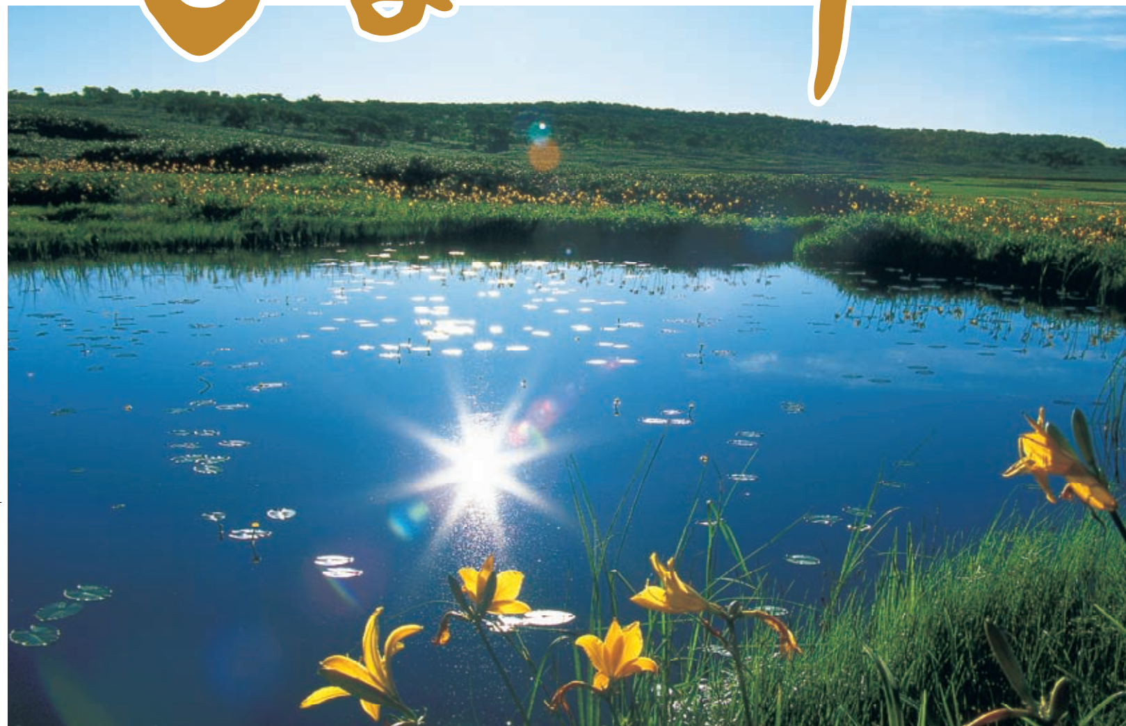
「エソカンソウ」