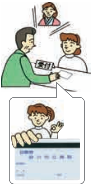
会計時に診察カードの提出をお願いします。

医療費のお支払いの際、本人確認のために、十月二日より【診察カード】が必要になりました。お支払い順番が来ましたら会計窓口職員に【診察カード】をお渡し下さい。なお、【診察カード】をお持ちでない方は、会計窓口職員へお申し出下さい。 ※自動精算機も設置しておりますのでご利用下さい。