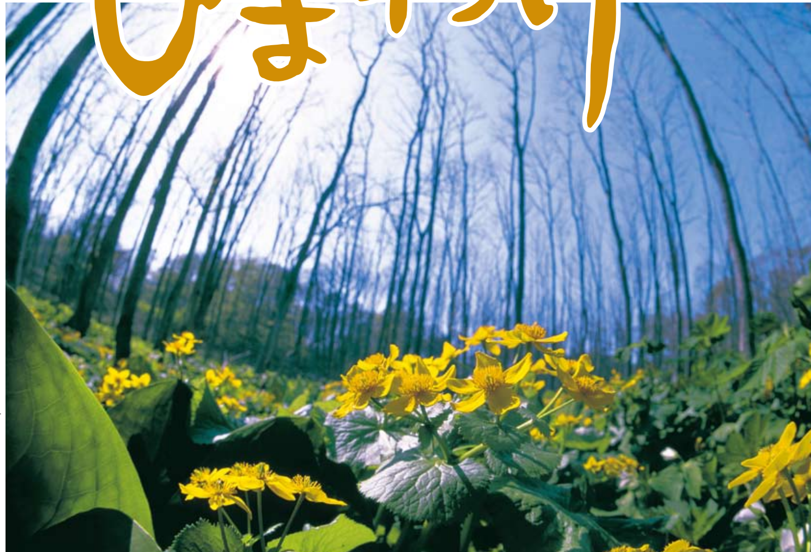
「エゾノリュウキンカ」