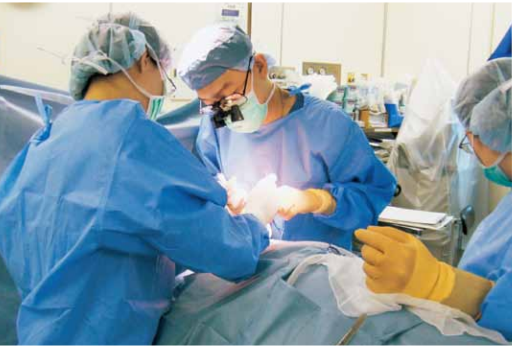
形成外科の手術中