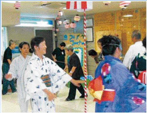
昨年の盆踊りの様子

毎年恒例となる 夏祭り盆踊りでは 今年も夏がきたと感じる いい機会ではないか と思ひます。 是非多くのおみなさまの ご参加をお待ひ しております。