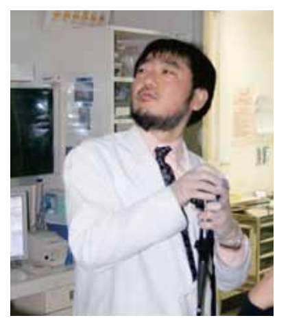
内視鏡検査の様子

EMR …平坦なポリープを切除するため液体を注入してからポリープを切除する手技 ESD …内視鏡的粘膜下層はくり術 EIS …硬化剤という薬剤で静脈瘤を治療するもの EUS …内視鏡超音波検査、内視鏡を体内に挿入して行う検査 ポリペクトミー …内視鏡によるポリープ切除術 ERCP …総胆管に内視鏡の先に付いた細いチューブを挿入して、造影剤を注入し、胆道系、膵管を直接造影する安全性の高い検査 EST …内視鏡的乳頭括約筋切開術 IDUS …管内超音波検査