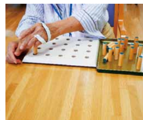
手の麻痺に対して指の細かい運動の様子

者さまには期待した以上に好評で「気分転換になる」「生き返る」なかには「ミニトマトなんかあったらもいで食べられるの」という話があったとか無かったとか?「冬場も見られるといいのにね」という声もありました(院長先生、北大病院には温室がありますよという影の声)。最後にこの記事をご覧の皆様にお願いです。最近の傾向として入院直後から「廃用症候群」でリハビリを開始する患者さまがふえています。簡単に言う「寝たきり予備軍」。重篤な疾患が無いのに日常生活に何らかの支障をきたしている状態です。