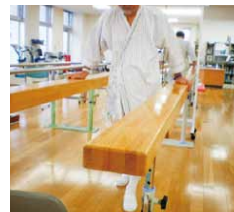
平行棒にて歩行練習中の様子

人(欠員)と三五倍に増え、その中には新規導入された言語聴覚士や作業療法士が総計五人含まれています。また二十代三十代のフレッシュなスタッフが十人と過半数を占め仕事場に勢いと活気があります。ご高齢の方が多い患者さまにしても若いスタッフと接する事は心身ともに良い刺激になっているようですが、人生経験の差からスタッフが軽くあしらわれている場面も散見されるのはご愛嬌でしょうか。もう一つのウリは専用施設ではないのですが屋上の花壇に直接アクセスできるとい点です。入院し屋内でのあまり変化のない生活を送っている患