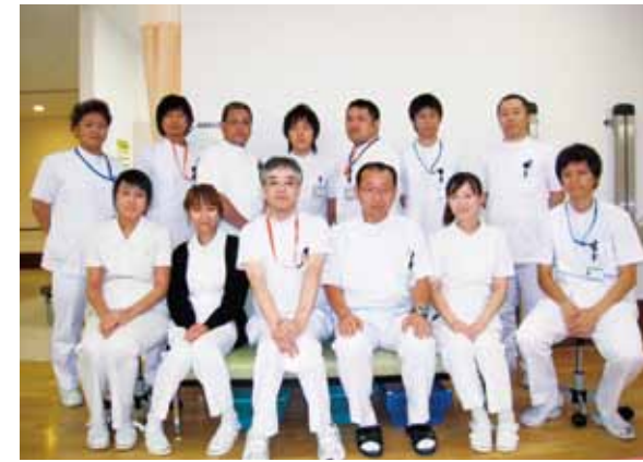
リハビリテーション部スタッフ

精神科リハビリテーションは別の機会に譲る事として、今回は身体障害に対するリハビリテーション部門の部署紹介ということでお鉢が回ってきましたが、当部門では最先端のとか最新鋭のというキレイのいいキャッチコピーの機器類は導入いたしませんでした(できませんでした)。その代わりにこれまでの二倍を上回る広さのリハビリ室とそれに見合う人材の確保を希望し達成する事ができました。人材について詳しくご説明しますと二〇〇二年には四人だったスタッフが現在は定員十四