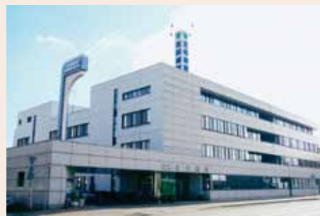
医療法人社団 慶北会 花田病院