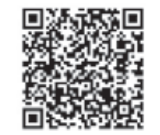
産後ケアについて 詳細はこちら