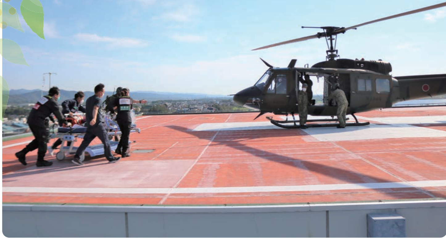
(滝川駐屯地・砂川市立病院による協働災害訓練の様子)